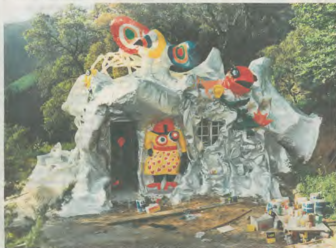
Fonds Rico Weber/MAHF/Espace Jean Tinguely-Niki de Saint Phalle Fribourg

Cette première œuvre géante encouragea Niki de Saint Phalle dans cette voie qui l'a conduite plus tard à imaginer «Le jardin des tarots» en Toscane. Ses inspirateurs ont pour noms Gaudi, le Facteur Cheval ou encore Salvador Dalí. A voir jusqu'au 31 décembre. Adresse: espace Tinguely-Niki de Saint Phalle, rue de Morat 2, www.fr.ch/mahf Horaire: de 11 h à 18 h (me-di) et de 11 h à 20 h (je)